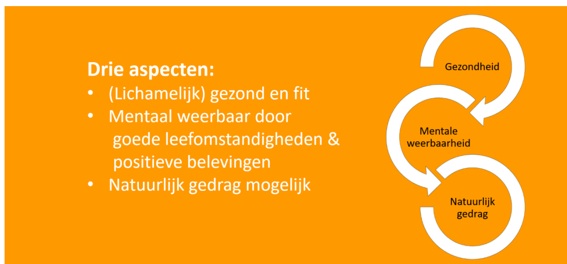
Figuur 1 – De drie aspecten van kwaliteit van leven

De mate van aanpassing van elk wezen aan zijn omgeving is beperkt. Levensomstandigheden moeten daarom passend zijn. Onze flexibiliteit kent zijn grenzen. Dat geldt ook voor de hond. Zo kan een hond meestal wennen aan leven op een flat. Echter alleen, als er aan voorwaarden wordt voldaan. Zulke voorwaarden zijn bijvoorbeeld dat de hond genoeg beweging krijgt en genoeg in de natuur komt. Naast welzijn wordt tegenwoordig vaak de term ‘kwaliteit van leven’ gebruikt (MacMillan, 2005). Kwaliteit van leven meet de door het dier ervaren kwaliteit van leven. Dit wordt uitgedrukt op een schaal van goed tot slecht, op basis van een balans tussen de ervaringen die plezierig zijn en die onplezierig zijn. Het gaat hierbij over het individuele dier en de psychologische impact van gebeurtenissen op dát dier. Drie aspecten zijn van belang voor kwaliteit van leven, zie Figuur 1.