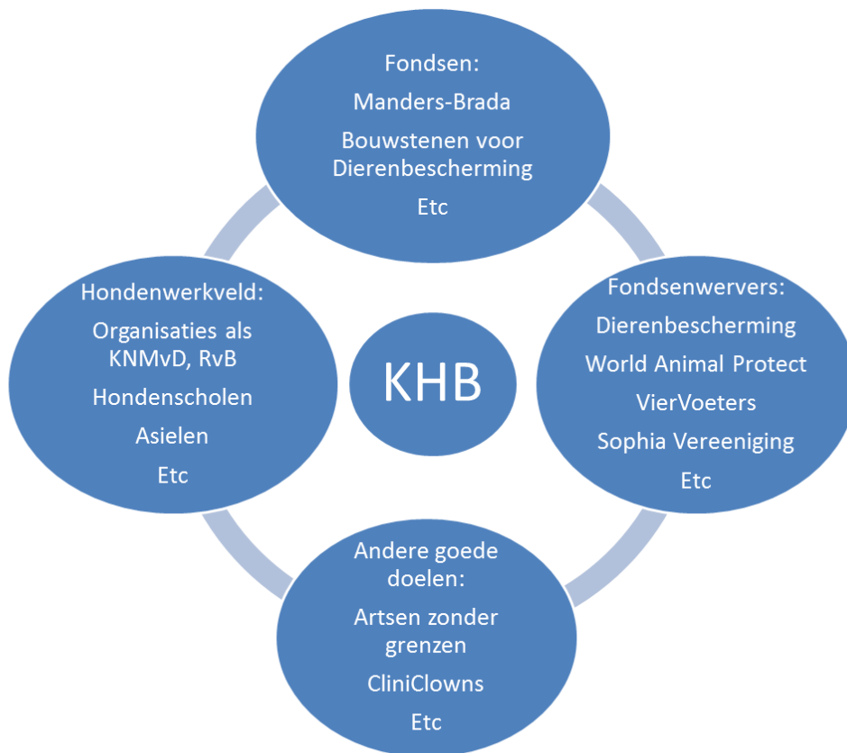
Figuur 3 - Organisaties in het veld rondom de KHB

Elke organisatie opereert in een omgeving die in beweging is. De KHB is enerzijds een goed doel, anderzijds is zij een dierenwelzijnsorganisatie en bevindt ze zich in dit speelveld. Tot slot maakt zij deel uit van het hondenwerkveld. Figuur 3 geeft de verschillende partijen rondom de organisatie weer.